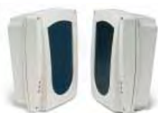
BR100 PANNELLO REMOTO