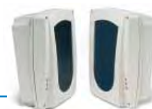
BR100 REMOTE SIGNALLING PANEL

• Il pannello remoto BR100 della AVS Electronics, garantisce la costante visualizzazione dello stato delle barriere incendio. La BF100A possiede un'uscita seriale dedicata, che permette di collegare con tre conduttori il modulo remotizzatore. E' sufficiente spostare il modulo a Led-Display dalla barriera al Modulo BR100 per avere le indicazioni dei livelli di segnale, dello stato di ogni singola unità, di effettuare reset e test di massimo 4 BF100A.